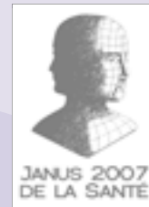
Prix de Design

Ce fauteuil est l'aboutissement de l'oeuvre de Rainer Küschall : le mouvement fluide d'une assise presque suspendue dans les airs.